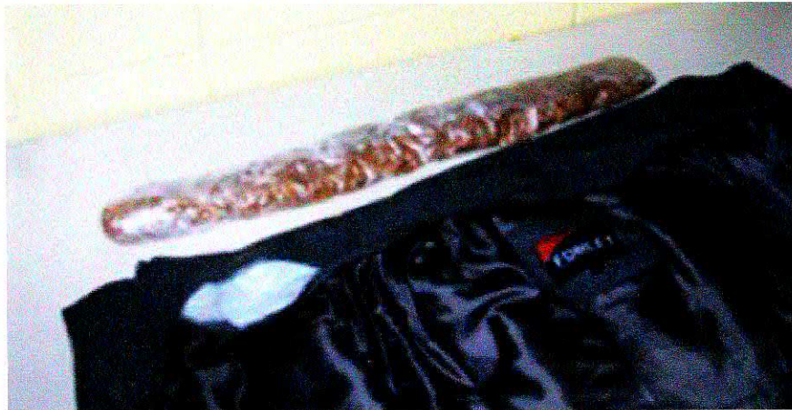
Du tabac emballé dans une doublure de manteau.

La drogue dissimulée, c'est le grand ennemi des gardiens, qui font face à des trafiquants de plus en plus ingénieux.