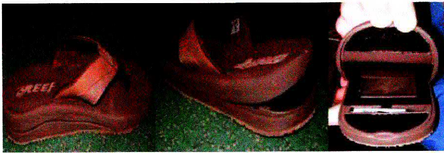
Des semelles creuses.