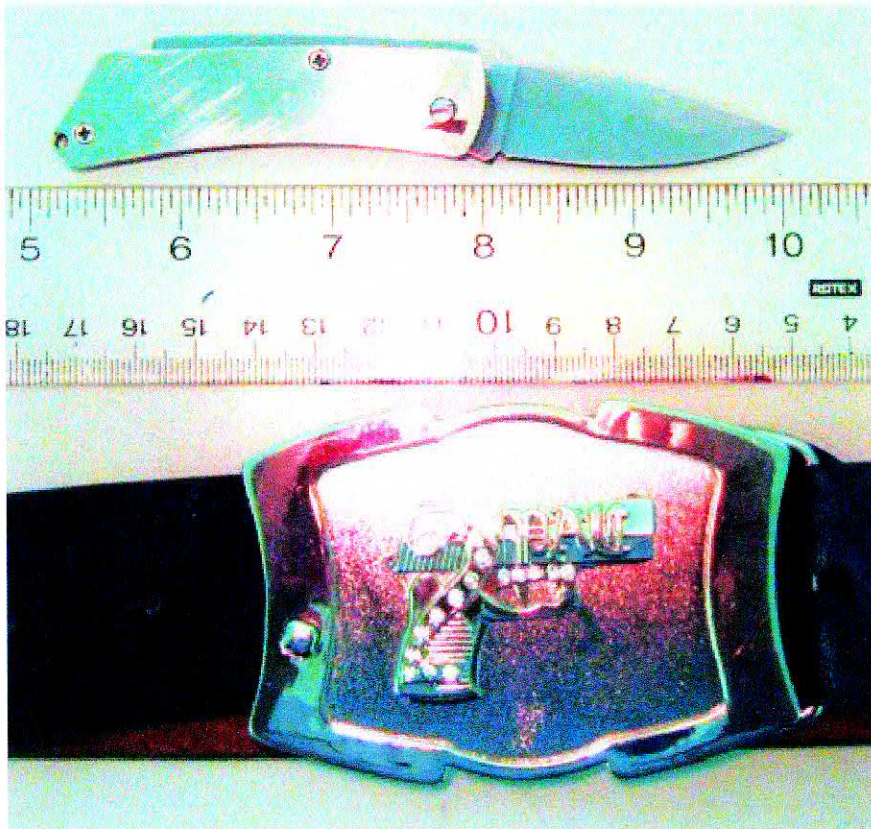
Un canif dissimulé dans une boucle de ceinture.